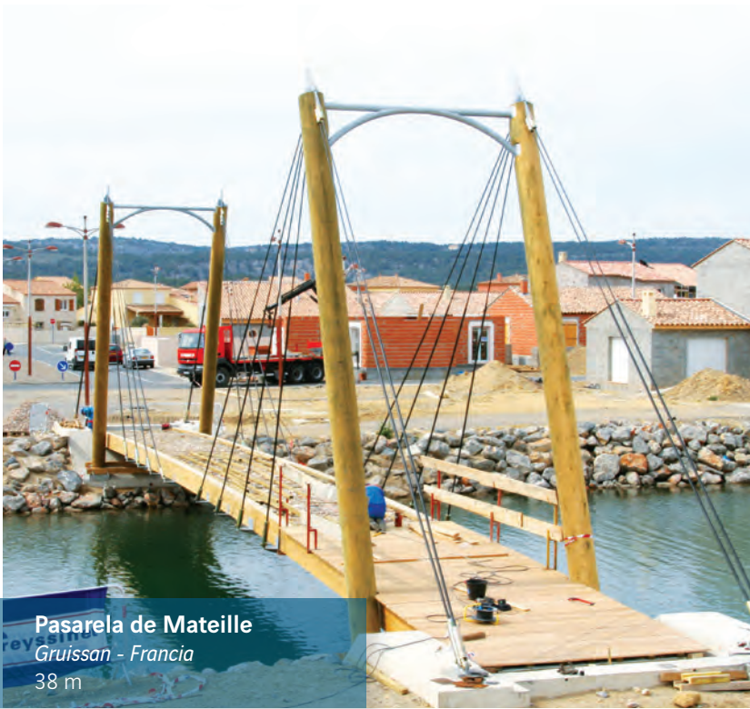
Pasarela de Mateille Gruissan - Francia 38 m