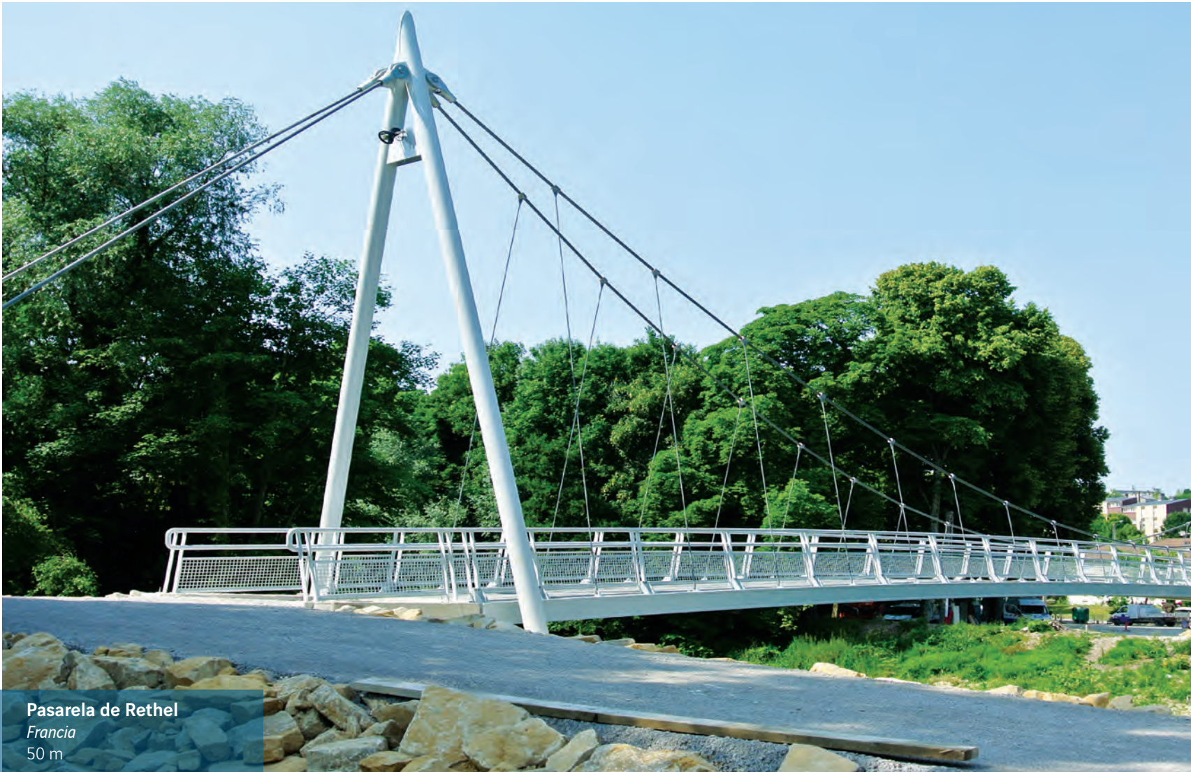
Pasarela de Rethel Francia 50 m