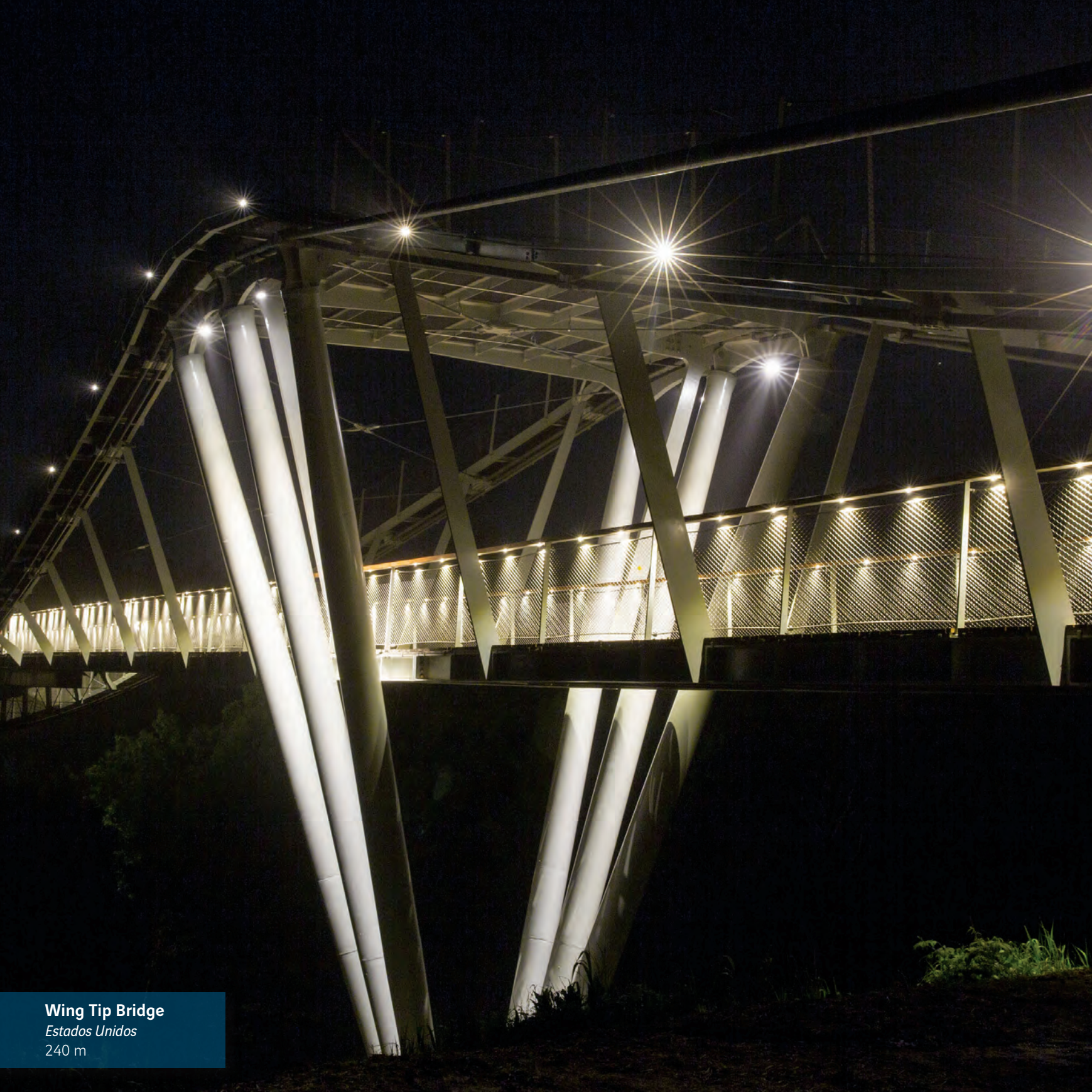
Wing Tip Bridge Estados Unidos 240 m