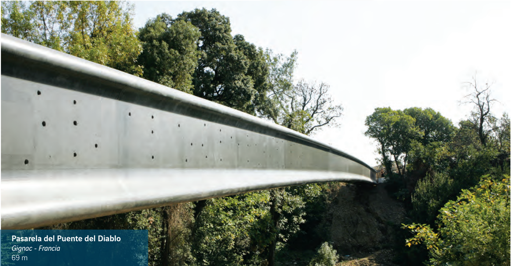
Pasarela del Puente del Diablo Gignac - Francia 69 m