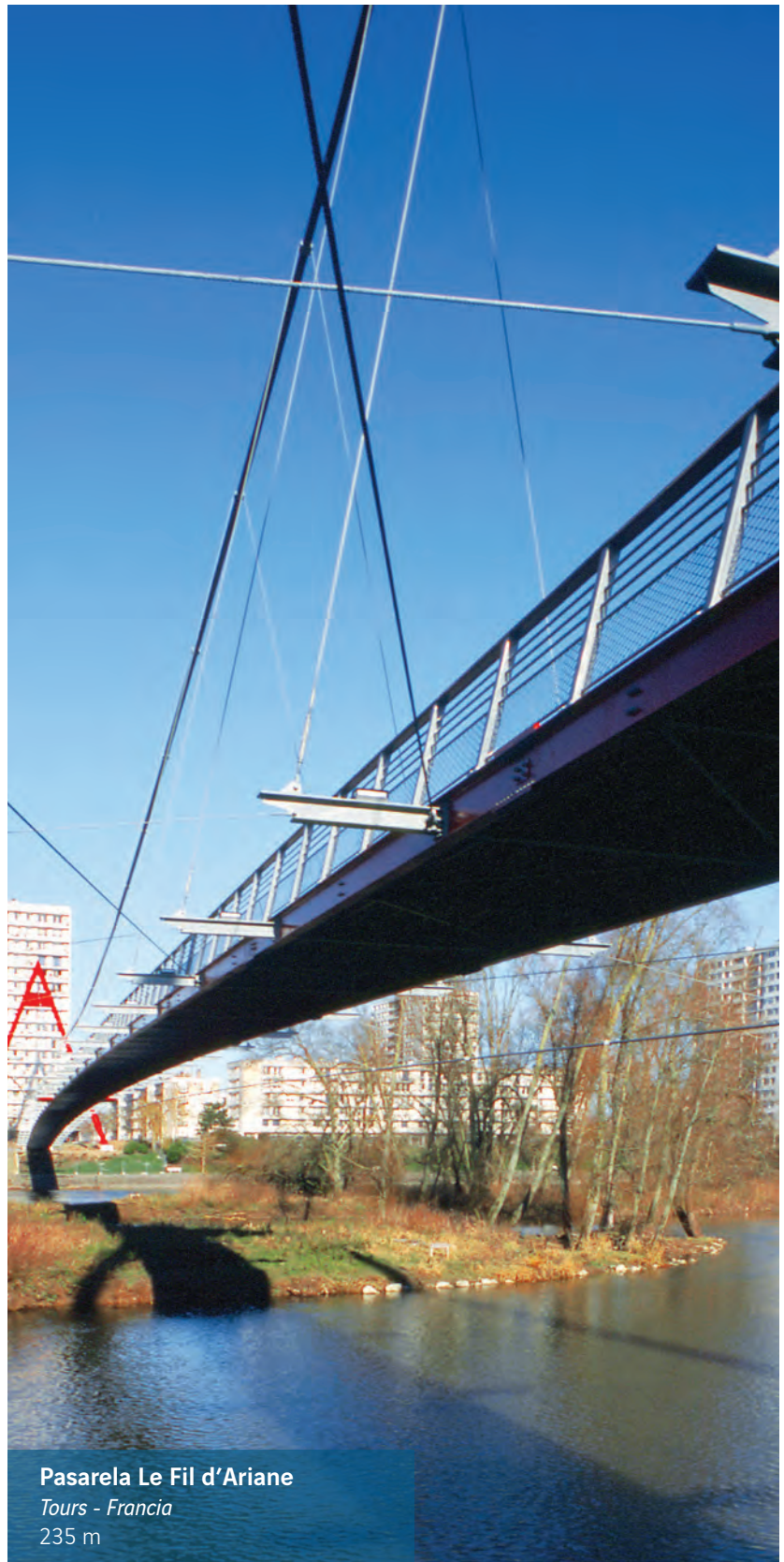
Pasarela Le Fil d'Ariane