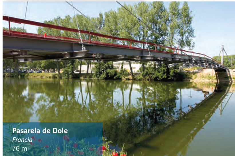
Pasarela de Dole