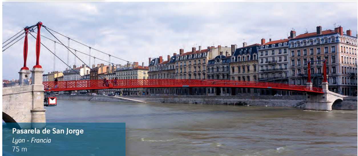
Pasarela de San Jorge