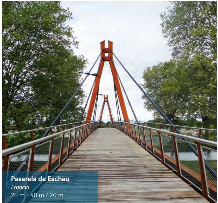
Pasarela de Eschau Francia 20 m / 40 m / 20 m