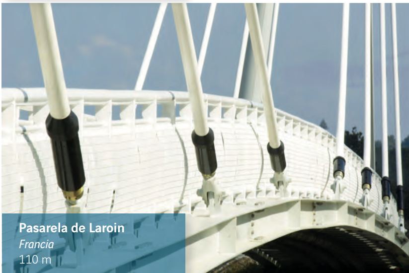
Pasarela de Laroin