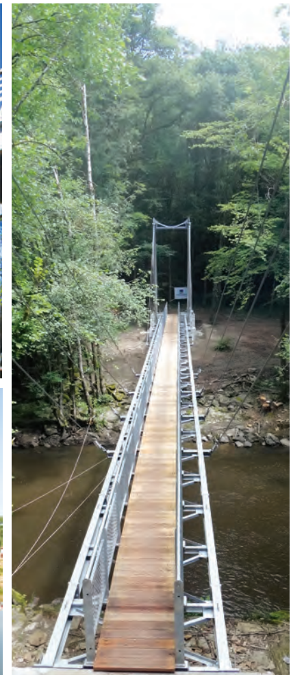
Pasarela de Fresselines