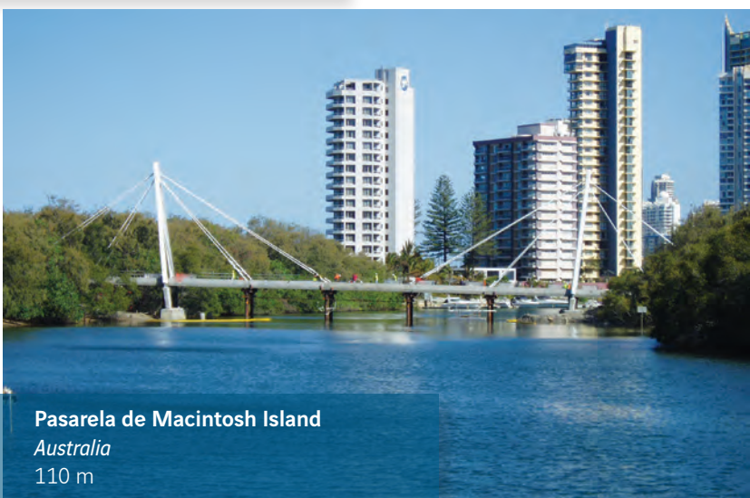
Pasarela de Macintosh Island Australia 110 m