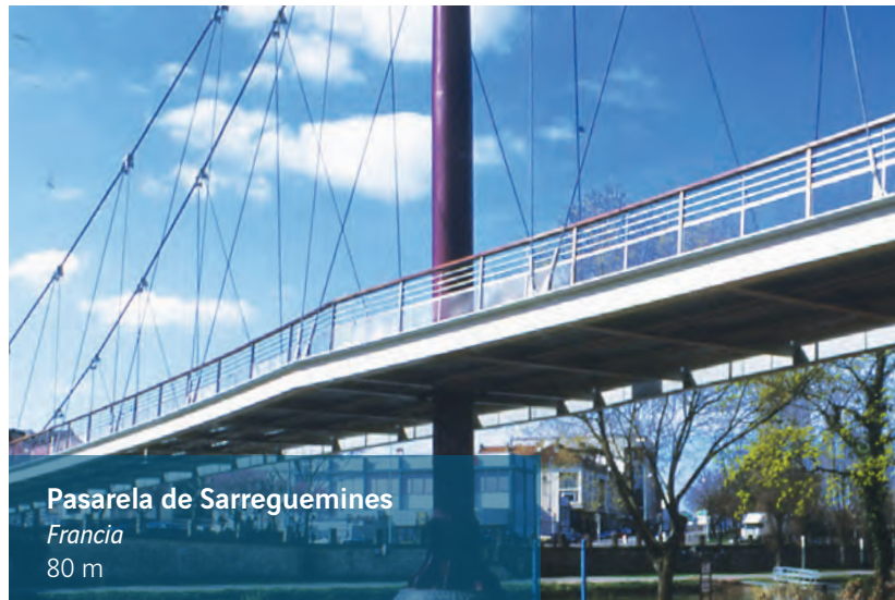
Pasarela de Sarreguemines

Destinada a integrarse de manera armoniosa en este entorno natural, la pasarela descansa sobre 2 pilones cuyos mástiles se despliegan en forma de «tridente» para estabilizarla lateralmente, al tiempo que posibilitan una estructura alzada y aérea para desviar los cables de suspensión que sostienen un tablero pavimentado con madera procedente de los bosques circundantes.