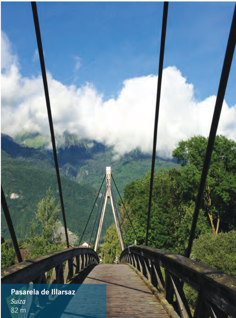
Pasarela de Illarsaz