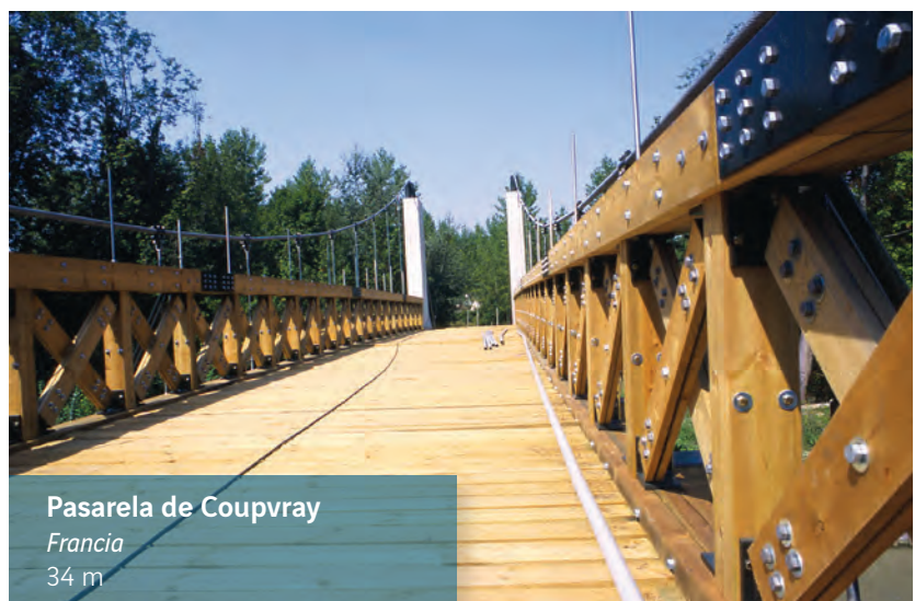
Pasarela de Coupvray Francia 34 m