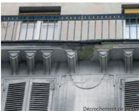
Décrochement de pierre