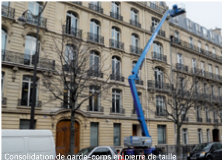
Consolidation de garde-corps en pierre de taille