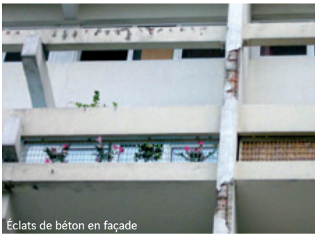
Éclats de béton en façade