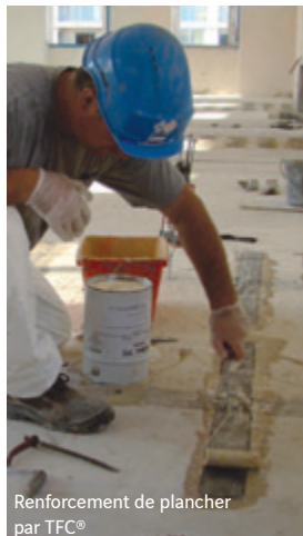
Renforcement de plancher par TFC®