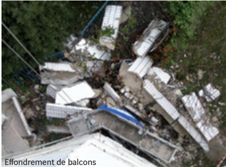
Effondrement de balcons