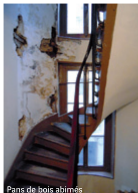
Pans de bois abîmés