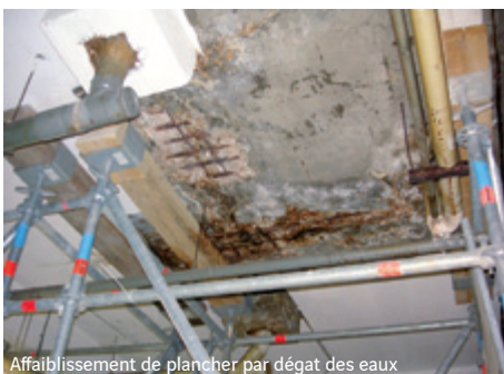
Affaiblissement de plancher par dégât des eaux