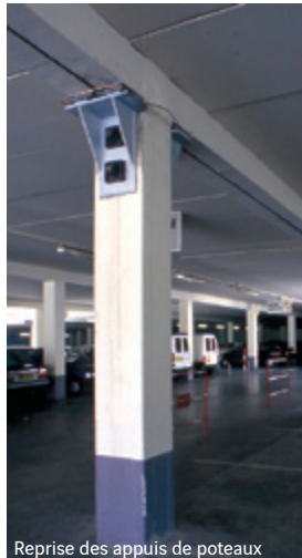
Reprise des appuis de poteaux