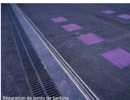
Réparation de joints de parking