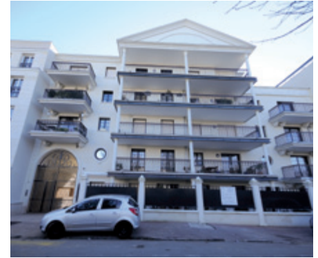
1/ Renforcement de garde-corps en bois 2/ Renforcement de balcons par TFC® 3/ Renforcement de balcons par précontrainte adhérente 4/ Ravalement de façades 5/ Injections de venues d'eau dans un parking