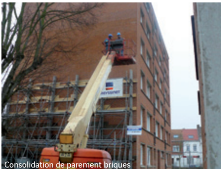
Consolidation de parement briques