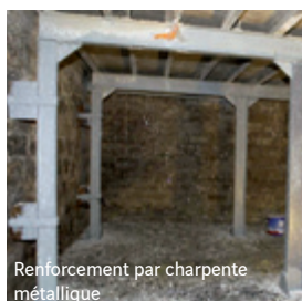
Renforcement par charpente métallique