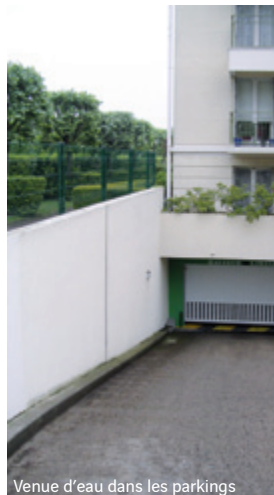
Venue d'eau dans les parkings