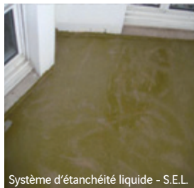
Système d'étanchéité liquide - S.E.L.