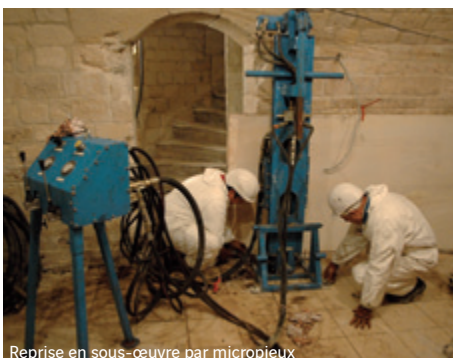
Reprise en sous-œuvre par micro-pieux