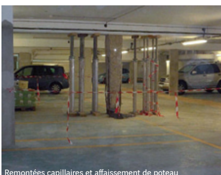
Remontées capillaires et affaissement de poteau