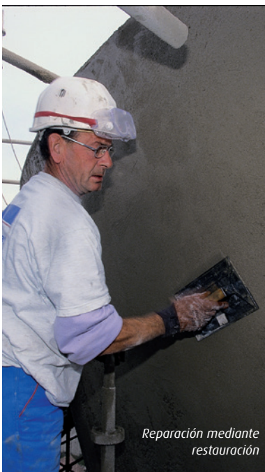
Reparación mediante restauración