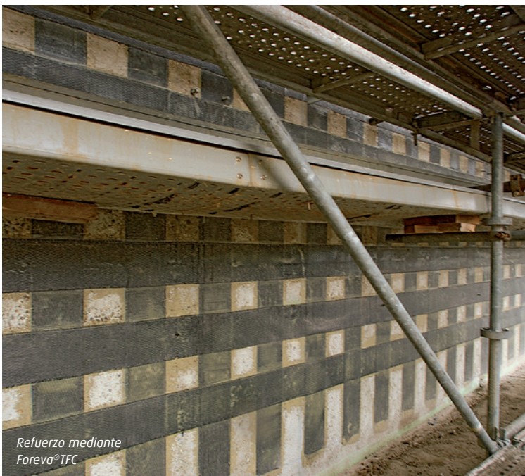
Refuerzo mediante Foreva® IFC

Para su servicio, contamos con equipos de especialistas que le ayudarán a determinar la solución Foreva® que se corresponde con sus necesidades.