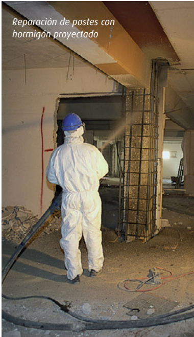
Reparación de postes con hormigón proyectado