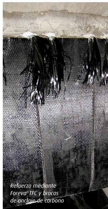
Refuerzo mediante Foreva® TFC y brocas de anclaje de carbono

Con la experiencia acumulada durante sesenta años, Freyssinet, empresa general de trabajos especializados, le ofrece, con Foreva® la garantía de una prestación llave en mano para la valorización duradera de sus estructuras.