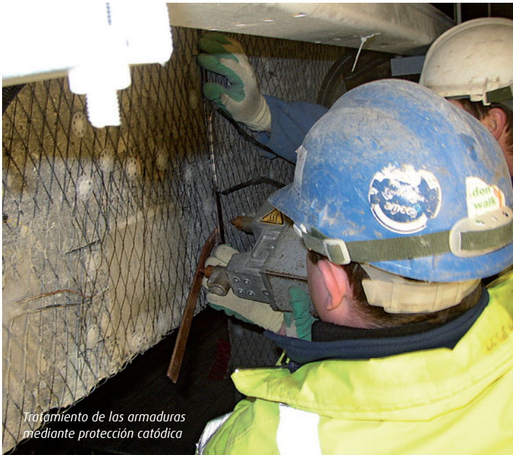
Tratamiento de las armaduras mediante protección catódica